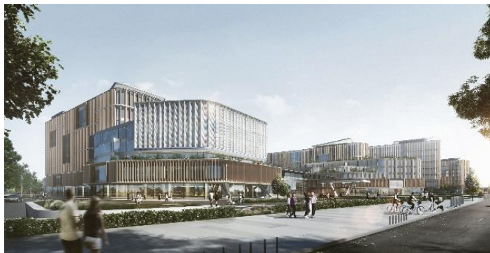
石家庄兆华医院发展回应现代城市需要