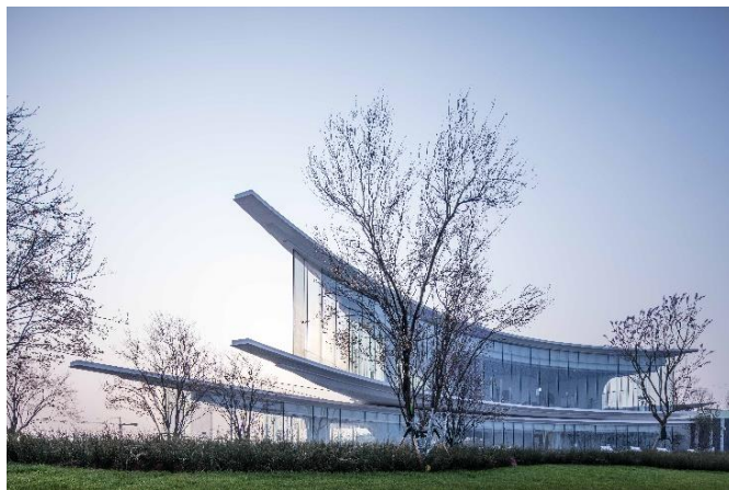
团队巧妙地撷取四周地形的精髓，勾勒出重庆江山云出·Legend 未来人居艺术馆的建筑形态