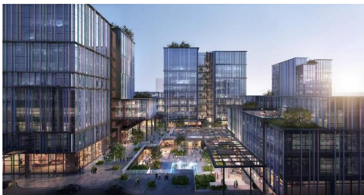
杭州缘谷科学园提出新的园林办公发展模式

品质是一个多面向的概念，而成功的方法同样多不胜数。LWK + PARTNERS 拥有多元化的设计专业，能兼顾不同群体所需。