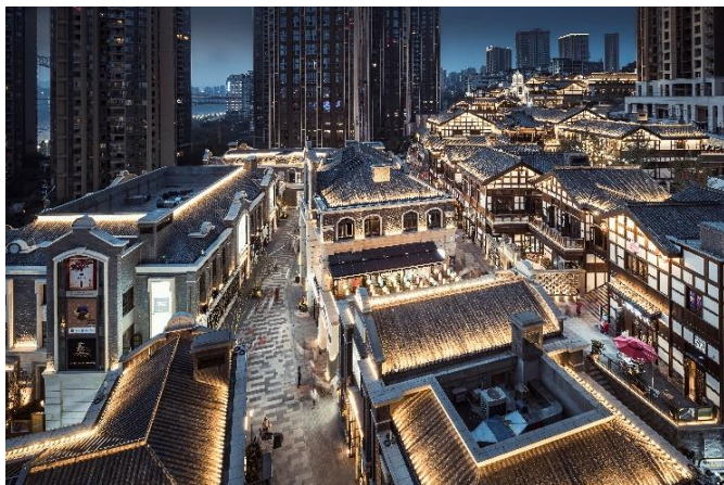
重庆长嘉汇二期：弹子石老街的背后是深厚的文化底蕴

我们的设计以人为本，从整体设计至项目细节，从概念以至实践的各个环节创造触动心灵的体验，塑造跨时代的生活态度及方式。