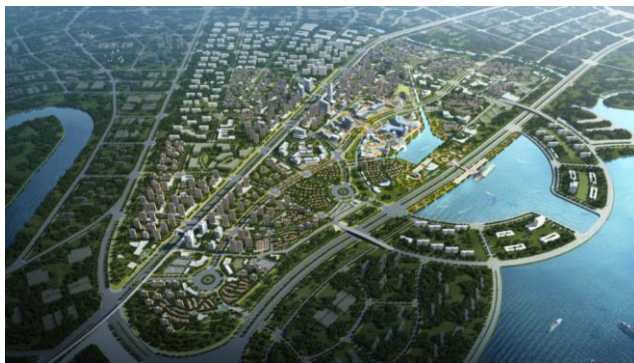
天津滨海新区航天城强化天津城市规划