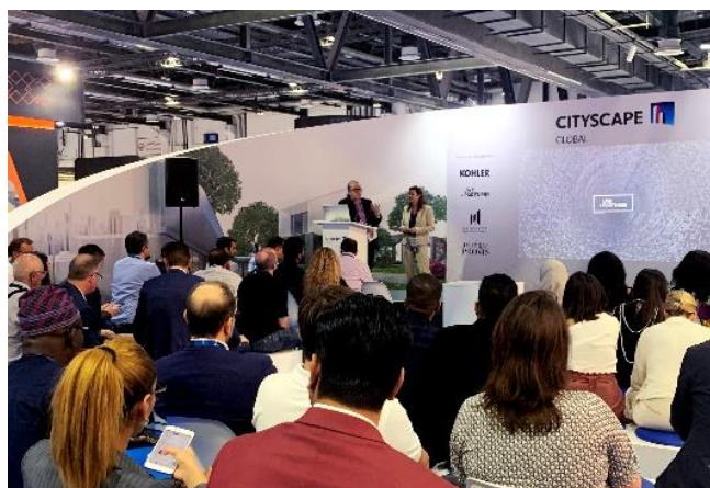
LWK + PARTNERS 董事们与业界分享深刻见解，体现共享知识的文化