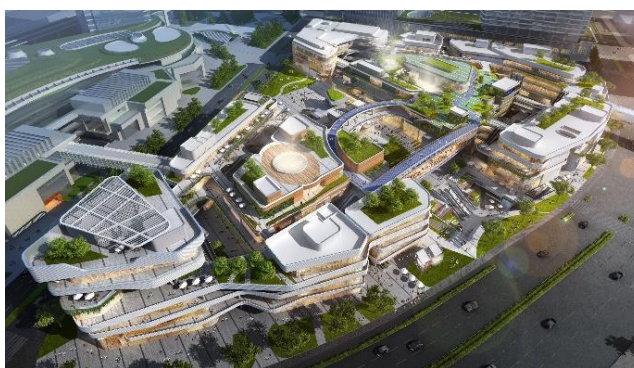
Lifestyle 团队为上海前滩太古里带来崭新零售体验