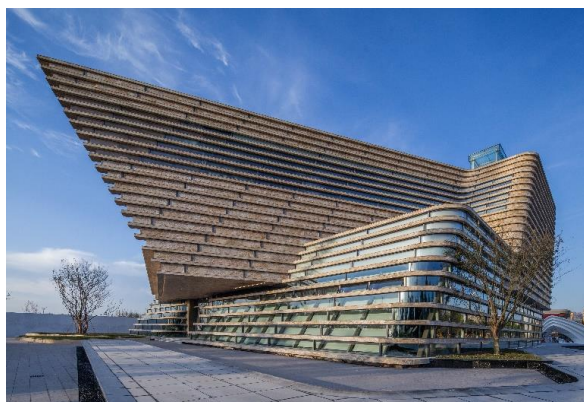
材质与线条的交织碰撞赋予青岛铂悦·灵犀湾商业展亭独特气质