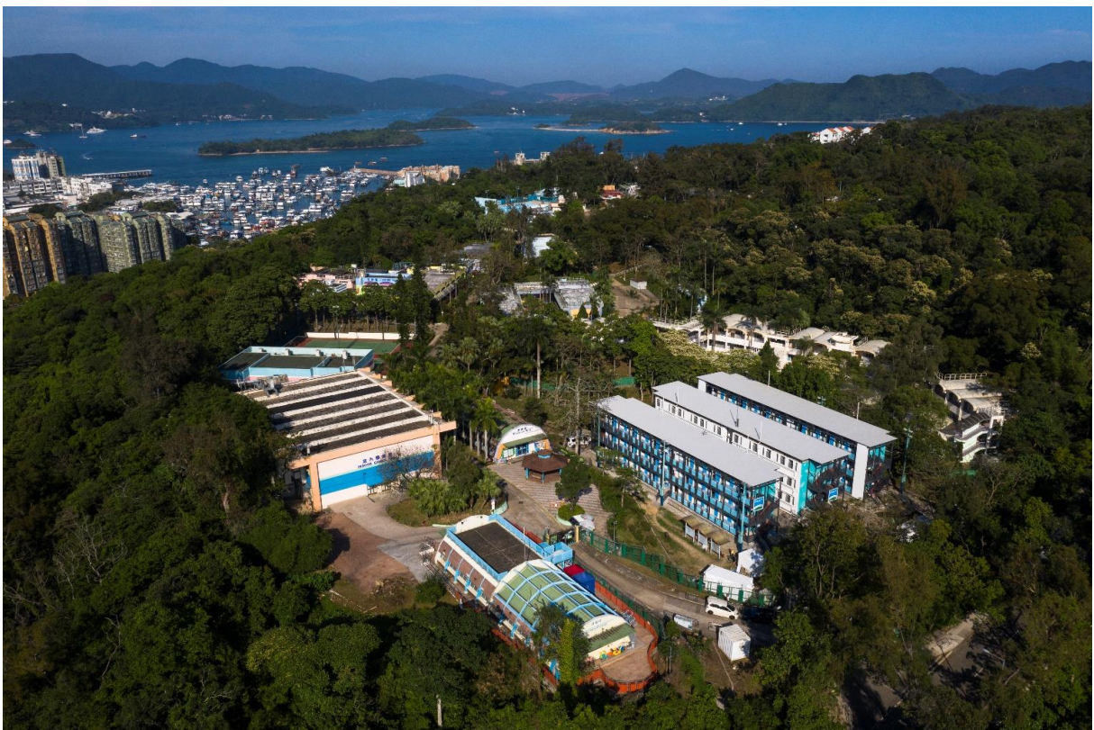
中国香港西贡户外康乐中心临时检疫设施

2019 冠状病毒病为全球各界带来各种挑战，但同时也加速了思维创新，为新技术提供试炼的机会。为协助香港特区政府適切应对疫情，LWK + PARTNERS 与保华建筑及 Paul Y. - iMax 合作，成功应用“组装合成”建筑法（Modular Integrated Construction, MiC），于 77 天内迅速完成西贡户外康乐中心临时检疫设施的设计及建造，三栋三层高的建筑于 2020 年 4 月底竣工后启用，可谓香港业界创举。